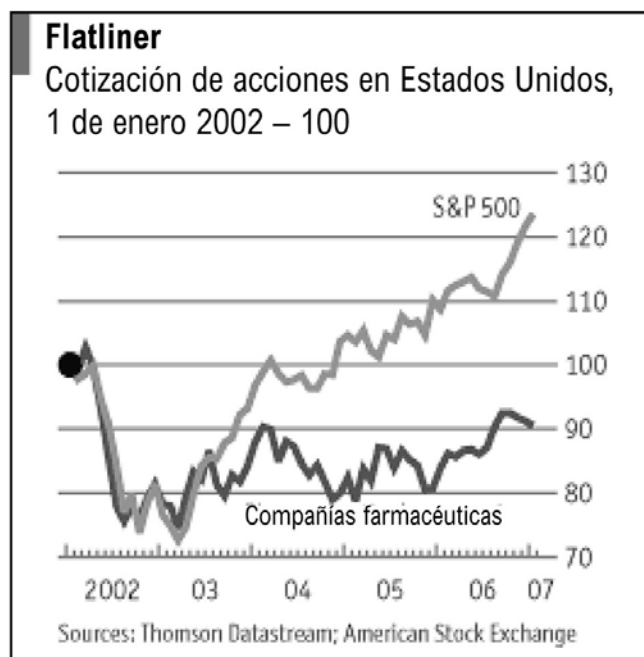
Figura 3: Flatliner – cotización de las acciones en los EE.UU